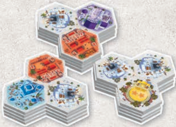
61 tuiles Cité